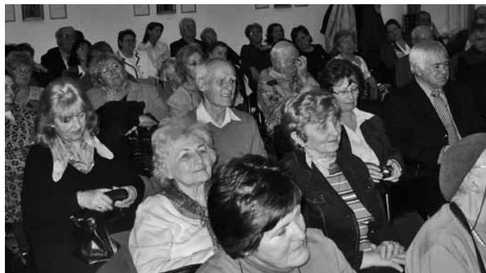
A márciusi klub közönsége

„Ilyen rendezvényünk még nem volt.” – Összegezte