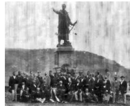
Az „újonnan” emelt Petőfi-szobor Segesvárnál