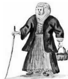
Csíki székely asszony, ahogy Marsigli látta

szolgáltak. A végleges kőépület már az alapító halála után, 1751-ben, a templom pedig 1727 és 1795 között készült el. Az iskola ma romokban van, a gimnáziumnak egy másik többszintes épület ad otthont, de a város szeretné egyházi segítséggel megmenteni, újjáépíteni az eredeti épületet.