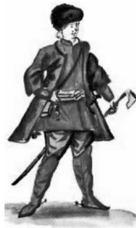
Székely katona az itáliai hadmérnök szemével

Guarini Bonaventura közbenjárása folytán XI. Ince pápa saját pénztárából évi