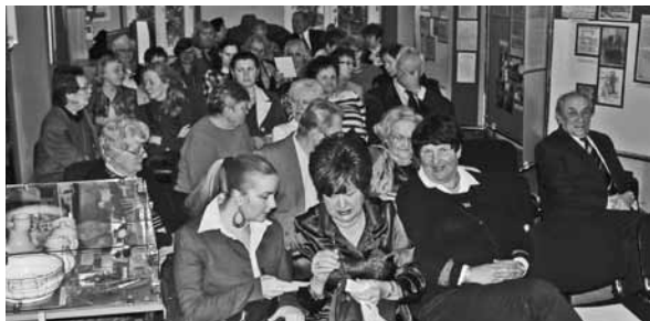
A Tabán Helytörténeti Kiállítás és Dokumentációs Köz-pont közönsége az Örmény Nemzetiségi Napon