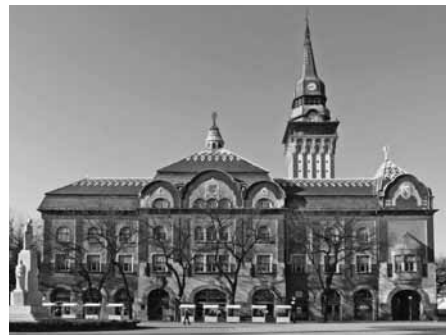
A szabadkai városháza