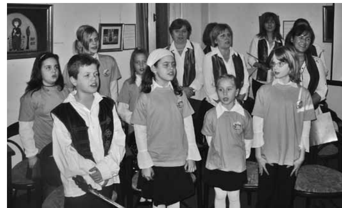
A Lemhényi Dezső Általános Iskola tanári- és gyermekkórusa

Március 15-re emlékeztünk ismét, amikor is a kórus elénekelt az Egressy Béni által megzenésített Talpra magyart, majd egy pár ismert Kosuth-nótát a klubest közönségével együtt. A kórus, a zenés barátok és a Tigrán együttes közösen megszólaltatta a Toborzódalt is, a Hány Jánosból.