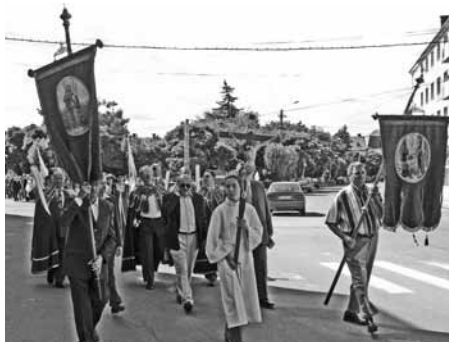
Körmenet Gyergyószentmiklós főtere körül

Szülföldjén, Maroshévízen, szeptember 4.-én szobrot állítottak a néhai magyar Országgyűlési képviselő tiszteletére. A negyedik alkalommal szervezett Urmánczy Em-