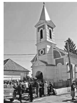
Gyülekezés a kopjafaavatásra