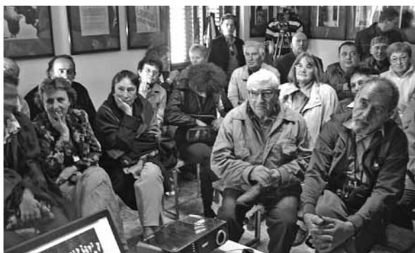
A közösségi ház közönsége