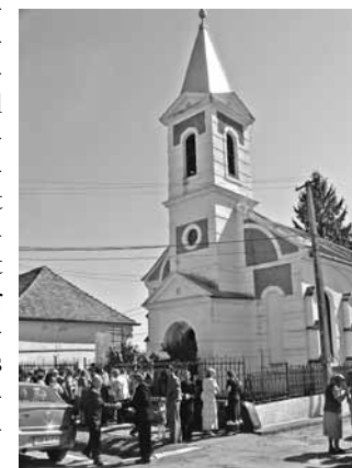
Gyülekezés a kopjafaavatásra