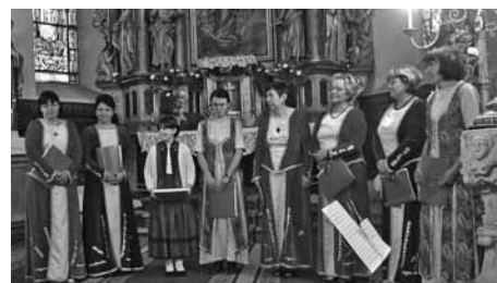
Szamosújvári örmény katolikus kórus

dagságot. Ezzel élnünk kell! Kötelességünk nemcsak őrizni, hanem megmutatni másoknak is, hogy tudomást szerezzenek az erdélyi örménység kulturális örökségéről, a magyar kultúrában elfoglalt helyéről.