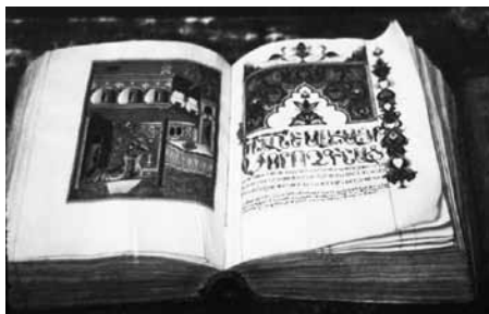
Meszrop Mastoch kódex

Látogatásunk egyik csúcsa a Matedaran kéziratár volt. A Kanaker dombon áll, szürke bazalttal borított, komoly-ságot sugalló épülete. Előtte Csubarjan alkotása: Ólében kőtáblát tartó, a nemzeti írásbeliség – nemzeti irodalom alapját, az örmény abc-t 406-ban megalkotó Meszrop Mastoch szobra látható. A főbejárat két oldalán álló bazaltszobrok az örmény kultúra és tudomány kiemelkedő személyiségeit: Movszez Chorenaci történetírót, Anania Sirakaci tudóst, a költő Friket, Mechitar Gos jogtudóst és állameseírót, Grigor Tathevaci filozófust, Thorosz Rozlin miniatúrafestőt ábrázolják. A Matedaranban az ókori népek által (görög-szír-örmény-héber-perzsa-római) 17 ezernél több, egészében vagy töredékben fennmaradt eredeti kézirat-kódexet őriznek, melyek a történelmi Örményország különböző területeiről, főként kolostorokból származnak. A kiállítótermekben könyvritkaságok sorakoznak: középkori első örmény nyelvű Biblia, vallásos ének (saragan) gyűjtemény, törvénykönyv, Lázár Evangelium 887-ből, M. Mastoch életrajz az 5. sz.-ból, az első papírra írt kódex 981-ből, vagy a 28 kg súlyú 607 borjúbőr lapot tartalma-