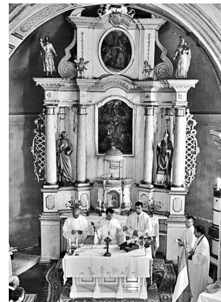
Ünnepi mise a római katolikus templomban

szorítására került sor, majd a résztvevők népes csoportja a helybeli római katolikus templomban hallgatta meg a Lászlóffy Árpád orgonaművész koncertjét. Ezután a közös ebéd következett, ahol felelevenítették a régi emlékeket és kapcsolatokat. Az érdeklődők megtekinthették a közel-múltban felújított örmény gyűjteményes