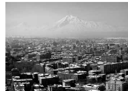
Jereván madártávlatból az Aratáttal

Ásatásokból előkerült i. e. 8. sz.-i épületromok arra utalnak, hogy ezen a helyen, az Urartu birodalom idején már létezett Erebuni települése, ahonnan a város mai elnevezése, Jereván is származik. A Hrazdan folyóvölgy i. e. 4. században la-