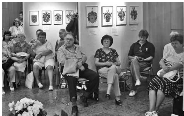
A címerkiállítás közönsége

„Őseink sok száz éves munkája, eredménye nem vesztet kárba, ezért nyílt meg ez a kiállítás is” – mondta a kiállítást megnyitó beszédében az elnökasszony. – „Az örmény őseink 1239-ben elmenekültek az ezeregy tornyú Aniból, Örményország fővárosából. Évszázad- (Folytatás a 6. oldalon)