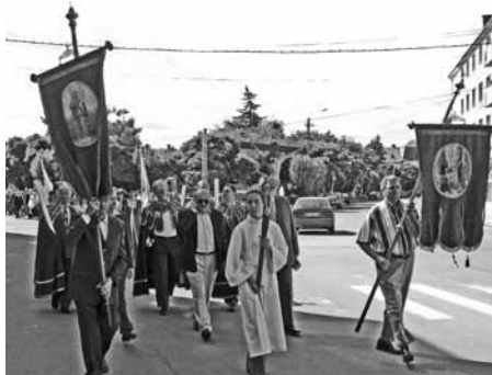
Körmenet Gyergyószentmiklós főtere körül