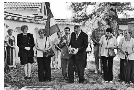
Az emléktábla megkoszorúzása