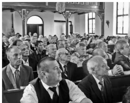
Az ünnepi istentiszteleten

napi búcsún találkozik az örmény gyökerű magyar közösség ismét egymással. A gyökerek fontosságát hirdeti az Erdélyi Örmény Gyökerek Kulturális Egyesület is, amely pl. kiadta hasonló kiadásban Ávedik Lukács: Szabad királyi Erzsébetváros monográfiája (Erdélyi Örmény Múzeum 9., Bp. 2004) c. könyvét és feldolgozta a város örmény katolikus temetőjét Örmény halottkultusz és temetkezés, Erzsébetváros és örmény katolikus temetője c. könyvben, mellékelve a temető teljes anyagát CD-n. A könyveket az egyházi könyvtár részére ajándékba átadta, hogy a mai erzsébetvárosiak megismerhessék városuk múltját, annak alapítóit és megbecsüljék azok örökségét.