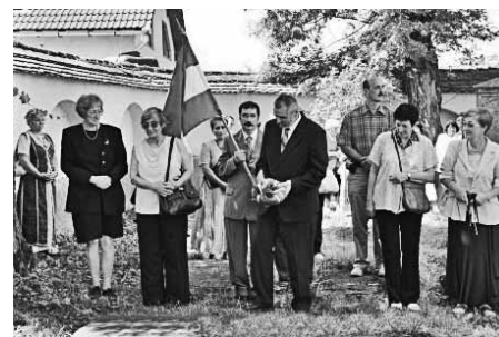
Az emléktábla megkoszorúzása

A találkozót a csíkkörzeti „Szentháromság Alapítvány” szervezte, a Budapest-Zuglói Örmény Kisebbségi Önkormányzat hathatós anyagi támogatásával. Az ünnepség szentmisével kezdődött a csíkszépvízi templomban, amelyet nagyméltóságú Szakács Endre vikárius úr mutatott be Gábor Zoltán plébános úrral együtt. A mise után a templom udvarán levő emléktábla ko-