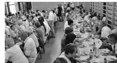
A családi találkozó résztvevői

(www.pluszportal.ro., 2011. szeptember 1.)