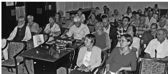
A Fővárosi Örmény Klub szeptemberi közönsége

vetkező politikai fordulat a művészetre is katasztrofális hatással volt. Az egyébként a művészetet és a művészeket saját céljaira a legmesszebbmenően fel- és kihasználó diktatúra nem csupán a tematikát határozta meg, hanem uralni kívánta a gondolat kifejezésének módját is, kötelezővé téve