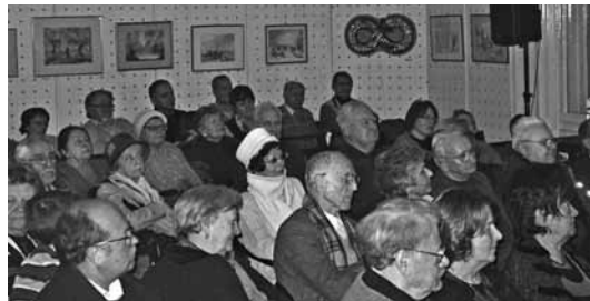
Az ünnepi est közönsége