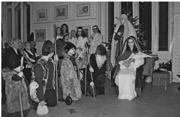
Szent Család Plébánia gyermek színjátszó köre