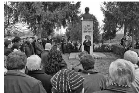
Ünnepség Ady szobránál

Az ünnepi beszédek a diákok szavatai követték, majd koszorúzással zárult az emelkedett hangulatú megemlékezés.