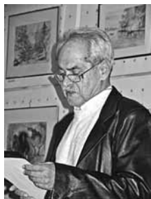
Csengőffy László színművész

A gyermekek játékát a hálás közönség nagy tapsal köszönte meg. A karácsonyi ajándékozási hagyomány ezúttal sem szakadt meg, a klub háziasszonya mindenkire gondolt, a gyermekeknek és a felnőtteknek is jutott ajándék. A gyermekek csomagja főleg édességet és mandarint tartalmazott, míg a felnőttek szép örmény kódexmotívumokkal díszített képeslapot kaptak üveges fényképekbe foglalva. Az év utolsó klubdélutánja szíveslátással és könyvvásárral ért véget.