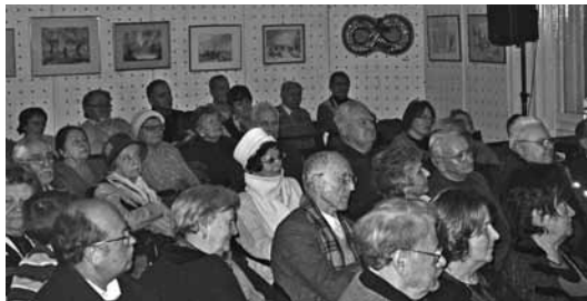
Az ünnepi est közönsége