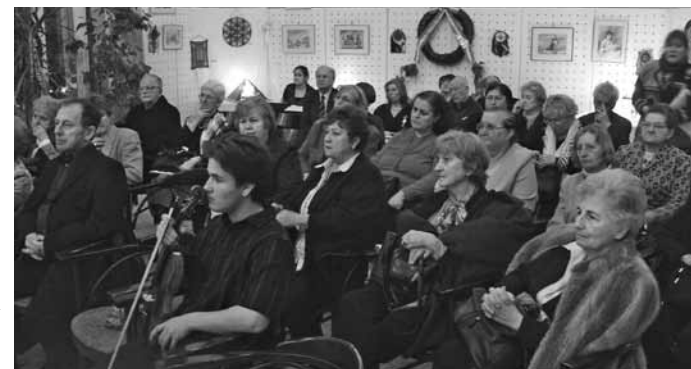
A decemberi klubdelután közönsége a Csontváry teremben

dott, népi jelleget öltött, népszokássá vált. De a faluban, amikor házról-házra jártak, nem lehetett minden jelenetet előadni időhiány miatt, hiszen sohasem értek volna a végére, ezért egy-egy mozzanatot tanultak be és adtak elő egy-egy háznál. Így egy-egy betlehemes öt-hat perces volt. Egyik háznál a pásztor