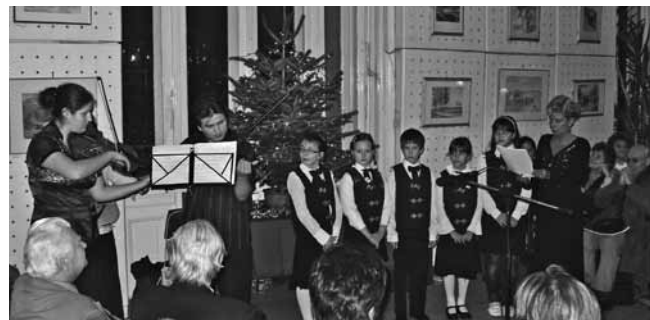
Benkő István Református Általános Iskola és Gimnázium kicsinyek kórusa