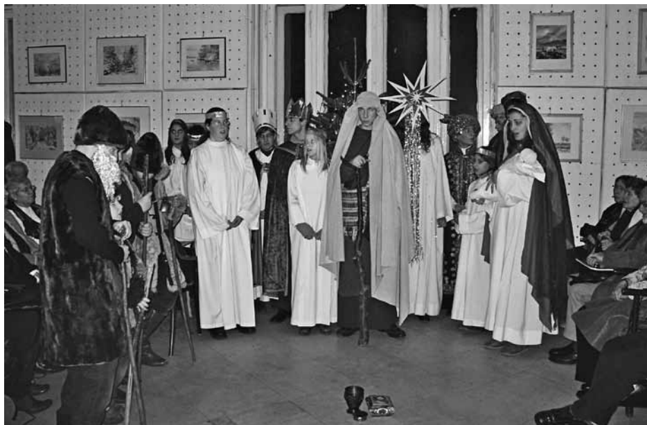
Szent Család Plébánia gyermek színjátszó köre (cikkünk a 2-4. oldalon)

Az Erdélyi Örmény Gyökerek Kulturális Egyesület folytatja a pénzadományok gyűjtését az erdélyi magyarörmény közösségek részére. Pénzbeli adományok az egyesület bankszámlájára befizethetők.