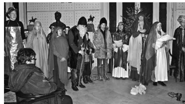
Szent Család Plébánia Gyermekek Színjátszó Köre

Sünohorvó Nor Tari! Boldog Új Évet kívánunk!