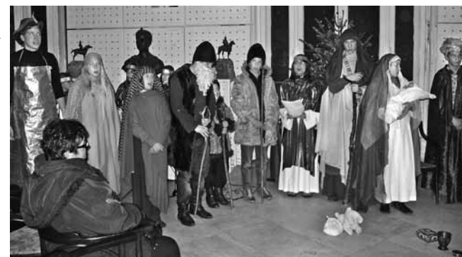
Szent Család Plébánia Gyermekek Színjátszó Köre

Sünohorvó Nor Tari! Bóldog Új Évet kívánunk!