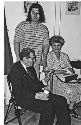
A Vákár család

Számos alkalommal szerepel díjnyertes pavilonterve a Budapesti Nemzetközi Árumintavásáron (1933, 1934, 1937, 1940), ezekhez hasonlóan több díjat nyert