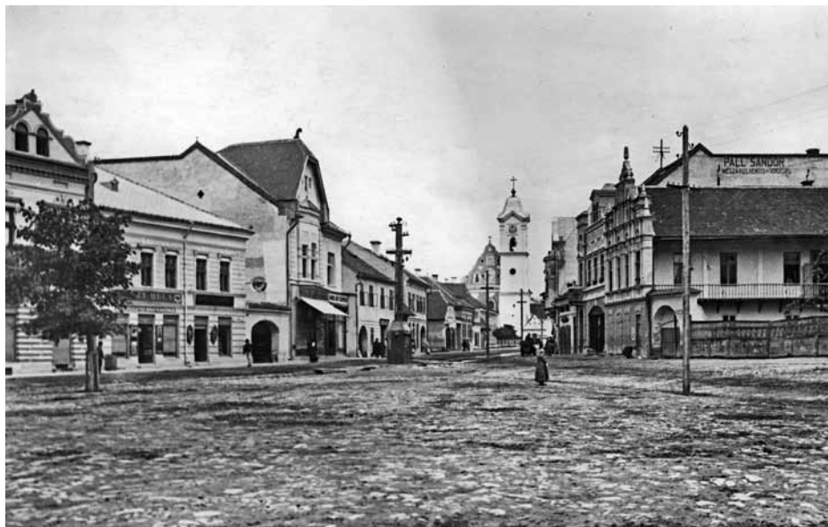
Gyergyószentmiklós főtere 1911 körül (cikkünk a 22–28. oldalon)

Az Erdélyi Örmény Gyökerek Kulturális Egyesület folytatja a pénzadományok gyűjtését az erdélyi magyarörmény közösségek részére. Pénzbeli adományok az egyesület bankszámlájára befizethetők.