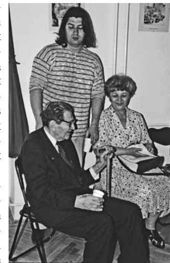
A Vákár család

Számos alkalommal szerepel díjnyertes pavilonterve a Budapesti Nemzetközi Árumintavásáron (1933, 1934, 1937, 1940), ezekhez hasonlóan több díjat nyert