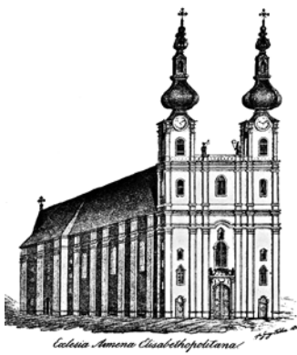
Az erzsébetvárosi katedrális a XIX. sz. első felében