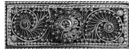
Öv részlet, Budapesti Örmény Katolikus Lelkészség, 19. sz.

Csak meghívottak részére! A kiállítás április 6-tól szeptember 15-ig látogatható.