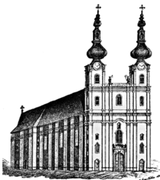
Az erzsébetvárosi katedrális a XIX. sz. első felében