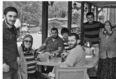
Egy ayderi szállodatulajdonos családja

város lett a székhelyük, ekörül évszázadokig egy viszonylag önálló keresztény fejedelemség létezett, amely különböző egymást váltó nagyobb királyságok vazallusa volt, de a nehezen hozzáférhető hegyes vidéken viszonylagos önállóságot élvezett. A korai elszakadás következtében az örménynek egy önálló, archaikus nyelvjárása alakult itt ki, amely azonban magas kultúrát is ki tudott alakítani. Hemsin nyelvjárásban készült középkori krónikákat is ismerünk. Az örmény apostoli egyháznak Kacskar nevű egyházmegyéje volt itt. Az Oszmán Birodalom 1491-ben foglalta el a területet. Az iszlámra való átterés évszázadokig folyt az ezzel járó sok feszültséggel és igazságtalansággal, és tulajdonképpen a 19. században vált teljessé. Jellemző volt ebben az időben az un. kriptokereszténység, amikor színleg áttértek az iszlám hitre, de titokban a keresztény szokásokat és sokszor a szertartásokat is megtartották. Ma a helyben lakó hemsinek nagy része töröknek vallja magát, csak néhány fiatal kezd öntudatra ébredni. 2000-ben készült el az első hemsin dialektusban beszélő film. Törökországon belül még tőlük keletre, Artvin tartományban van néhány település, ahol a hemsin nyelvjárást még beszélik, ők a nyelvüket homsecmá-nak nevezik. Törökországon kívül a Kaukázusban élnek még főleg keresztény hemsinek, részben Abházia, részben Oroszország területén. Ezen kívül nagyon sokan szétszóródtak a török nagyvárosokba és a nagyvilágba. Összlétszámukat mintegy 150 ezerre becsülik.