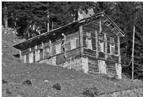
Régi hemsin ház, Ayderben

A hemsinek eredetéről a hivatalos magyarázat már homályosabb. Megírják, hogy iszlám vallásúak, de eredetileg keresztények voltak. Viszonylag későn tértek át az iszlám hitre, ezért jelenleg is elég könnyedén veszik ennek előírásait. Például a hemsin nők sosem viselnek fátylat, a férfiak nem vetik meg az alkoholt. Származásukról pl. a kiváló Lonely Planet útikalauzban az a homályos meghatározás van,