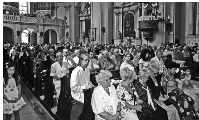
A mise résztvevői