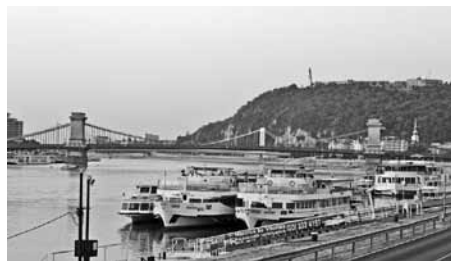
Indulás a Batthyány téri Duna-partról

Jártunk a Szerémség, Bácska, Bánság kövér termőföldű síkságain. Nevezetes templomokat, épületeket, romokat, természeti képződményeket kerestünk föl. Kö-