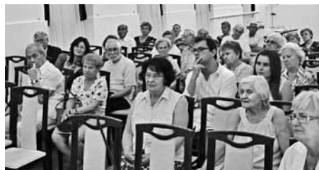
A Fővárosi Örmény Klub júliusi közönsége