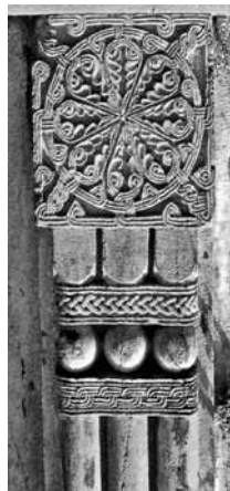
Örmény kőkereszt részlete

Az örmény liturgiában az utolsó vacsorai szavakat követően, a megemlékezések között olvashatjuk: Szent Khoszrov imája (ünnepi liturgiában)*