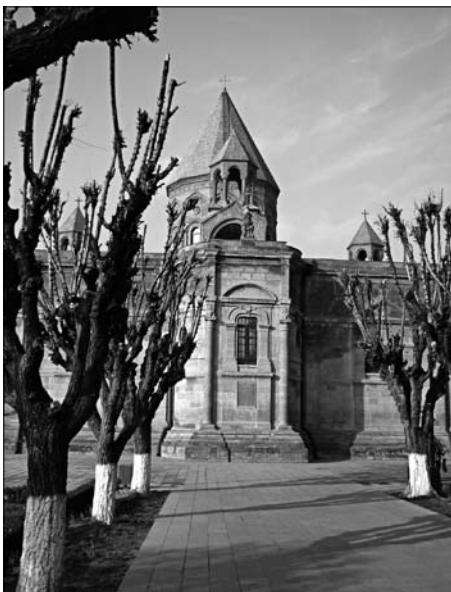
Szent Ecsmiadzin székesegyház

tegnap a piacokat jártuk végig; egy jereváni nőismerőst is magával hozta, aki a szamosújvári örmények körében kutatott jó félévig, s aki sok éve nem látott ismerőseként üdvözlő nagy lelkesedve, holott sosem találkoztunk.