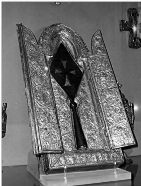
A láncza, amellyel Krisztust megsebezték a kereszten

megfelelően a koszt is istenes: sosem örültem még ennyire a magyar konyhá-nak – mondom is rögtön a nagybajuszú, leginkább vidéki nótafára emlékeztető, korosodó légikísérő úrnak, s összem-solygunk ezen.