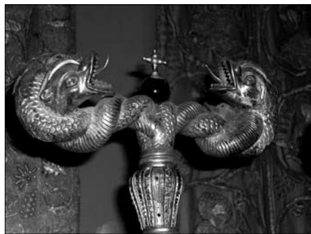
Az eredeti kígyófejes káváján