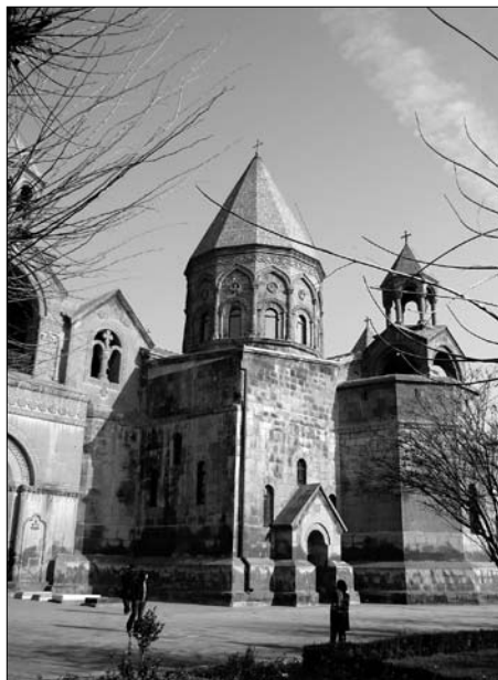
Szent Ecsmiadzin székesegyház

A számomra legérdekesebb „részleg” a hatalmas ékszerpiac-rész, ahol minden nő biztosan jól érezné magát, és örömmel feledkezne meg fagyról, múltó időről egyaránt. Nagy alkudozás árán veszek egy pár gyönyörűen megmunkált, türkizkőves ezüstfülbevalót – ahogy az ékszerész mondja, piruz , ez a türkiz örményül; úgy látszik, értékeli az alkudozásban tanúsított kitarásomat, mivel felajánlja, hogy ha jövő nyáron eljövök ismét, khorovácot süt majd nekem, addig is tervez kimondottan számomra egy pár szép örmény fülbevalót – pont így hívja, örménynek. De a textília-szektor is elképesztő gyönyörűségeket tartogat, még a pusztán szemlélődők számára is,