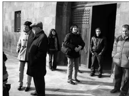
Kis csapatunk Ecsmiadzinban

Elkezdődik a vetítés – csak közben gondolkodom el azon, mennyire csodával határos, hogy ilyen sokan vannak a teremben: az összes film közül, amelyet a fesztiválon láttam vetíteni, az én filmemen van a legnagyobb közönség, ifjak és idősek vegyesen ülnek a sorokban, majdnem teltház. Ráadásul munkanap van, s még délután négy óra se, feltehetőleg még akik miattam jöttek ide, a velencei iskolatársaim is, a munkájukból vagy az egyetemről lógtak meg valamiképpen. A vetítés rendben folyik, szemmel tartom a közönségreakciókat, megfeszülve figyelnek, csupán két ember megy ki, ami dokumentumfilm esetében – mely ráadásul idegen nyelven és idegen felirattal zajlik – nagy szó. Van egy örmény