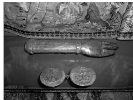
Ecsmiadzin Múzeum: az áldó jobb