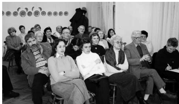
Szellemi táplálék a marosvásárhelyi örmény-magyaroknak

Vízkereszt az örmény katolikus hagyományban is epifánia ünneplése, viszont csak Jézus megkeresztelkedésére való emlékezés, eltérően a római katolikus hagyományoktól. Erdélyben Vízkereszt ünneplése inkább a házszeneléssel, mint a templomi ünnepléssel függ össze. Erdélyi és magyarországi örmények örmény származásúak és „szimpatizánsok” körében