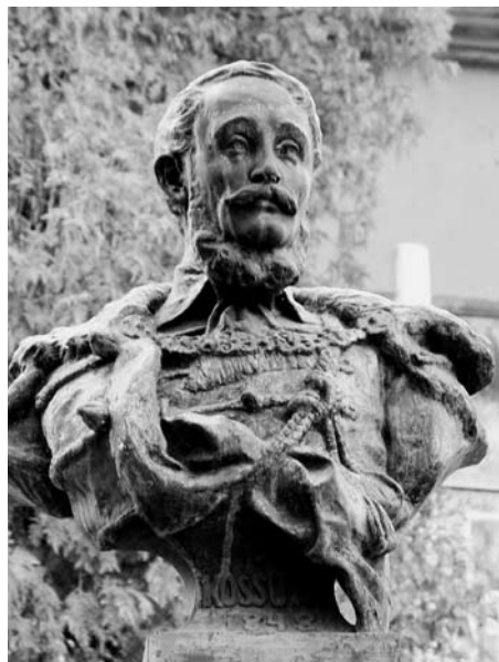
Kossuth Lajos mellszobra Técsőn

mást, mint őszi szélben a fellegek. Aztán élményeiről így számolt be lelkész barátjának: „... részemre itt ebben az örmény városban semmi említésre méltó esetet nem észleltem. Talán ha csak azt nem, hogy néhány keleti típusú arcvonásokkal bíró nagyon szép örmény asszonyt láttam sétálgatni az utcán...”