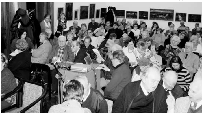
A februári klubesten nem fért több pótészék a Bartók termembe

dig egy angol tubadúréneket játszott el, Oroszlánszívű Richárd szerzeményét, majd később egy másik angol reneszánsz dalt, amelyet VIII. Henrik írt. Az időrendi sorrendben előadott dalok közben egyszer csak nemcsak egykori ének-