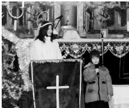
Szavalt az Angyalnak

2007. december 27-én délután szülők és gyermekek sokasága jött a kará-